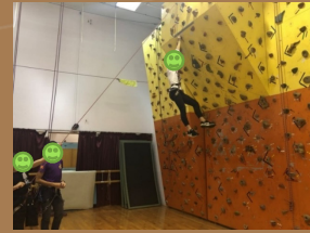
室內歷奇及攀登體驗