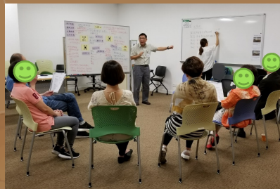
認知行為治療家長小組