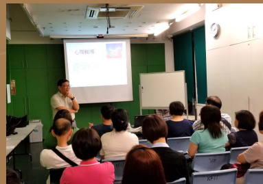
處理情緒壓力工作坊