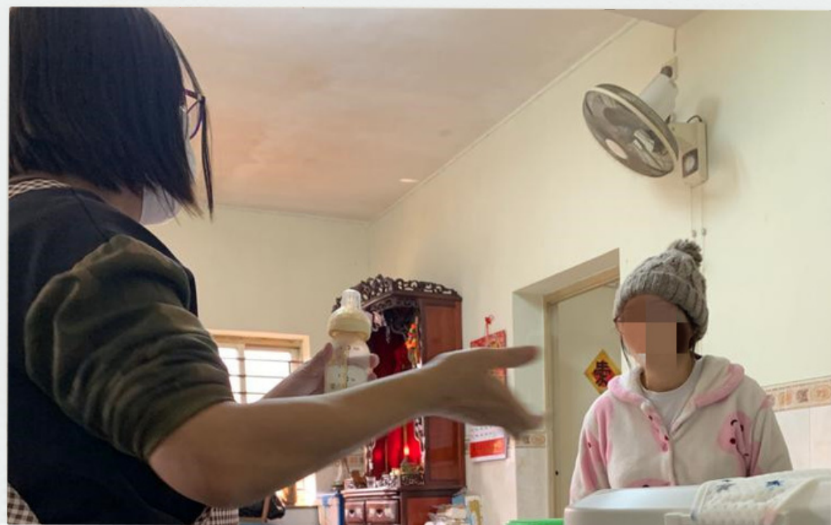
1. 陪月及育嬰指導服務

為 50個(140%) 有吸毒產婦/孕婦及 60 位吸毒孕婦/產婦家人提供以下服務: