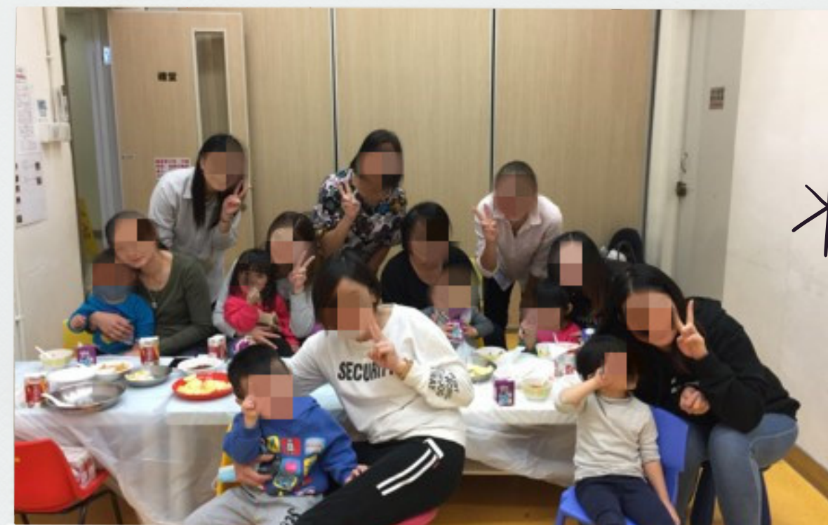
3. 媽媽網絡互助小組