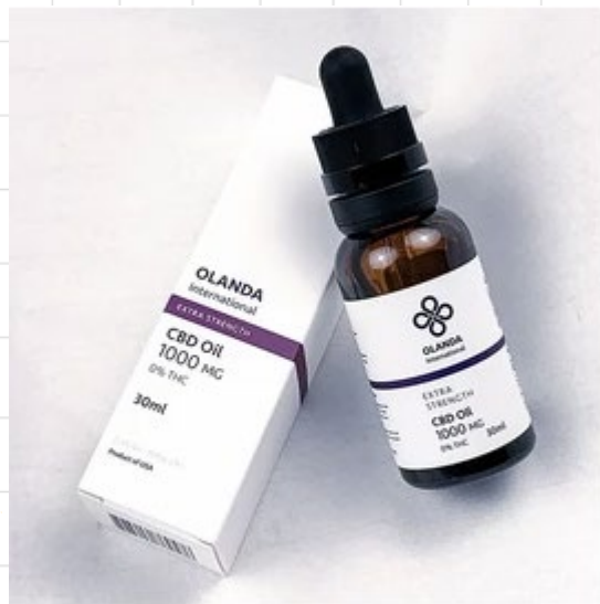
CBD強效止痛配方 Extra Strength