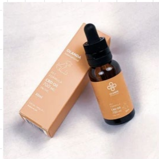
CBD寵物用紓痛配方 Pet Formula 700mg