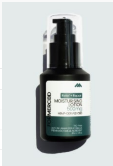
強效舒緩修護保濕乳液 500mg