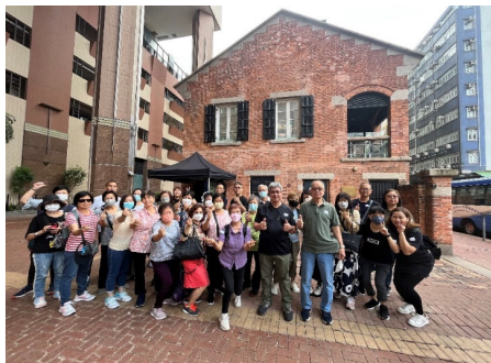
2023年5月6日親子一天遊