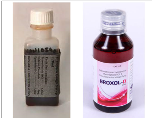
Cough Medicine / 咳藥