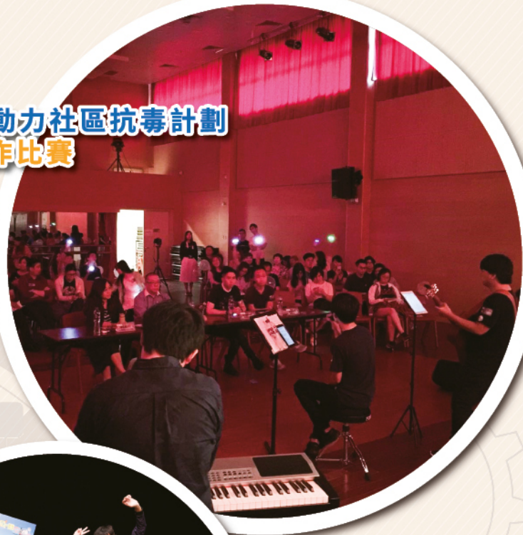
「快樂媒體」社區抗毒計劃 禁毒舞台劇