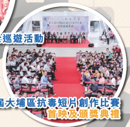
第三屆大埔區抗毒短片創作比賽 首映及頒獎典禮