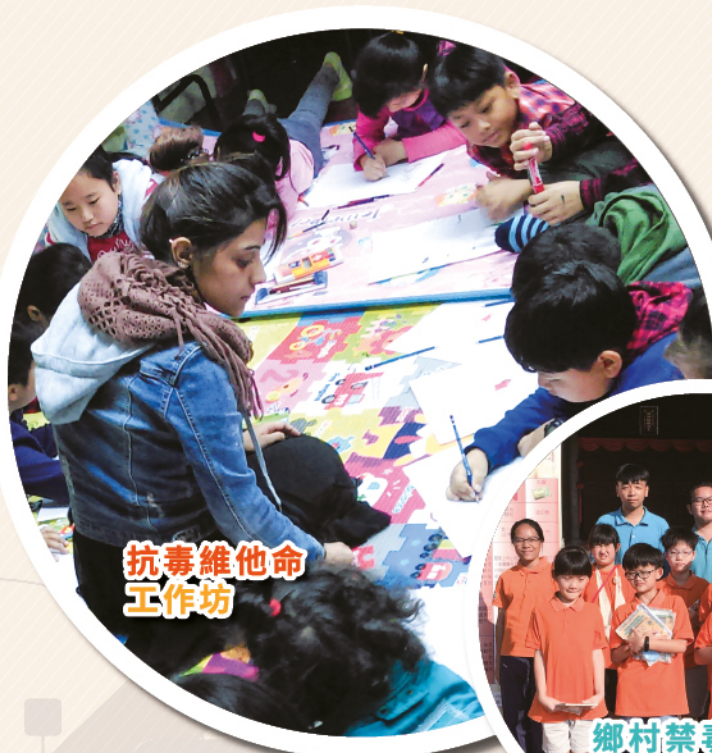
抗毒維他命 工作坊

為進一步加強禁毒宣傳教育效果，除了舉辦禁毒戲劇工作坊及學校巡迴演出外，更聯繫了區內周邊鄉鎮，展開鄉村禁毒宣傳展覽，透過禁毒宣傳展板和生動的案例講解，讓村民及學生了解到毒品害處和遠離毒品的重要性；而鄉村展覽有效地提高群眾對毒品的防範意識，居民紛紛表示要遠離毒品，共建和諧社區。