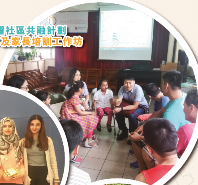
少數族裔飛躍社區共融計劃 兒童、青少年及家長培訓工作坊

此外，為了讓參加者認識香港毒品問題和成因，機構與戒毒人士中途宿舍合作，為前線人員及參與計劃的社區大使安排探訪、參觀及舉辦培訓工作坊，透過社工的解說及戒毒服務人士的分享，讓參加者關注隱蔽吸毒問題的嚴重性，增強對辨識不同毒品及預防毒品問題的能力。