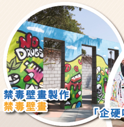
禁毒壁畫製作 禁毒壁畫

此外，舉辦以「企硬唔Take嘢」的標誌宣傳品為藍本的宣傳設計比賽，並舉辦頒獎典禮暨禁毒講座，讓區內小學生重新設計造型，提升他們拒絕吸毒的決心。此外，為了吸引區內人士關注吸毒問題，舉辦「禁毒大使」社區巴士巡遊活動，向居民派發禁毒宣傳品；並將禁毒與街頭藝術結合，邀請藝術團體及區內中學生一同於大埔海濱公園創作以禁毒為主題具並藝術特色的壁畫，美化公園及供區內居民欣賞之餘，藉以宣傳禁毒的訊息。