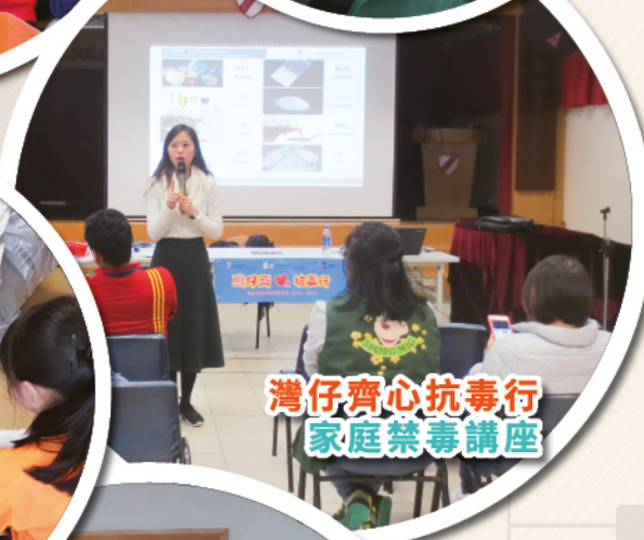
灣仔齊心抗毒行 家庭禁毒講座