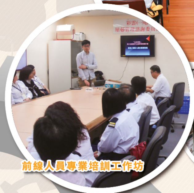
前線人員專業培訓工作坊