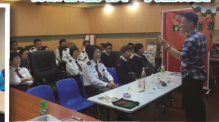
物業管理人員、大廈保安