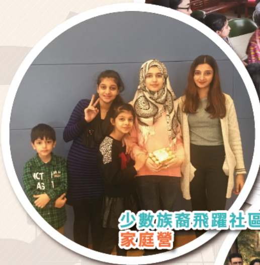
少數族裔飛躍社區共融計劃 家庭營