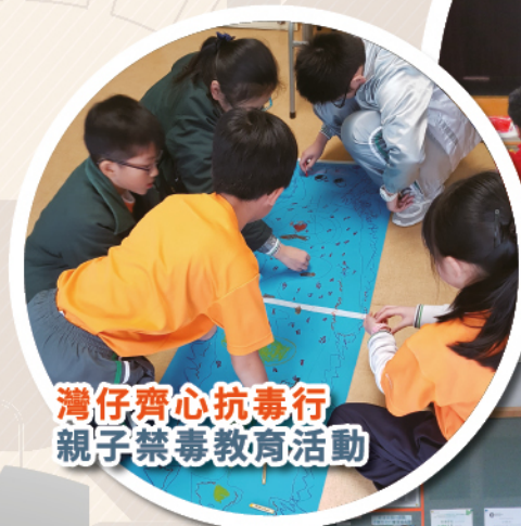
灣仔齊心抗毒行 親子禁毒教育活動