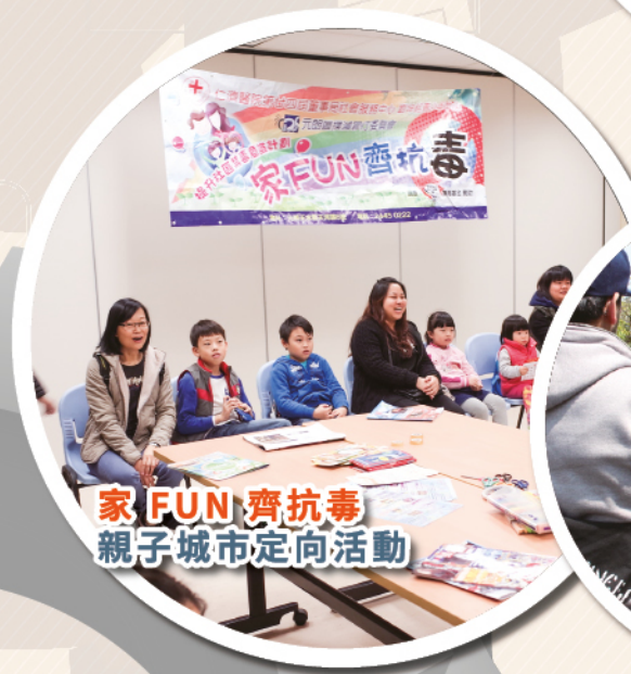
家FUN齊抗毒 親子城市定向活動