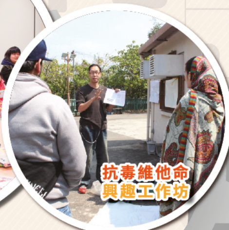
抗毒維他命 興趣工作坊