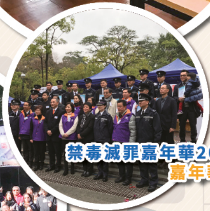
禁毒減罪嘉年華2017 嘉年華會