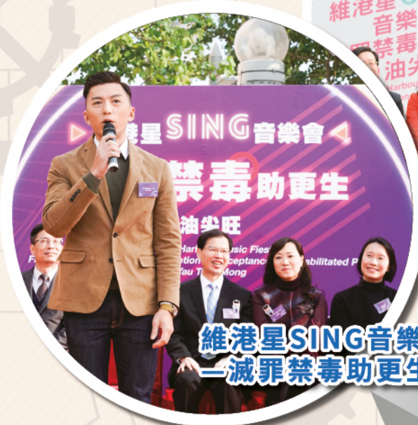
維港星SING音樂會 — 減罪禁毒助更生