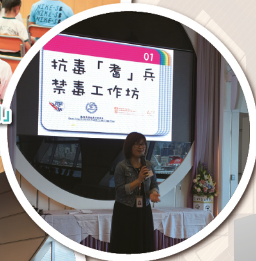
「提升社區禁毒意識計劃」 講座及分享會