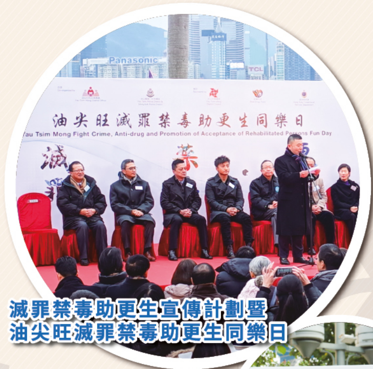
減罪禁毒助更生宣傳計劃暨 油尖旺減罪禁毒助更生同樂日

巴士巡遊、街頭表演及音樂會、宣傳品製作、深宵外展站、講座、小組、親子活動、過來人分享、音樂訓練、藝術培訓、興趣小組、健康檢查站、網絡遊戲比賽、外展醫道計劃