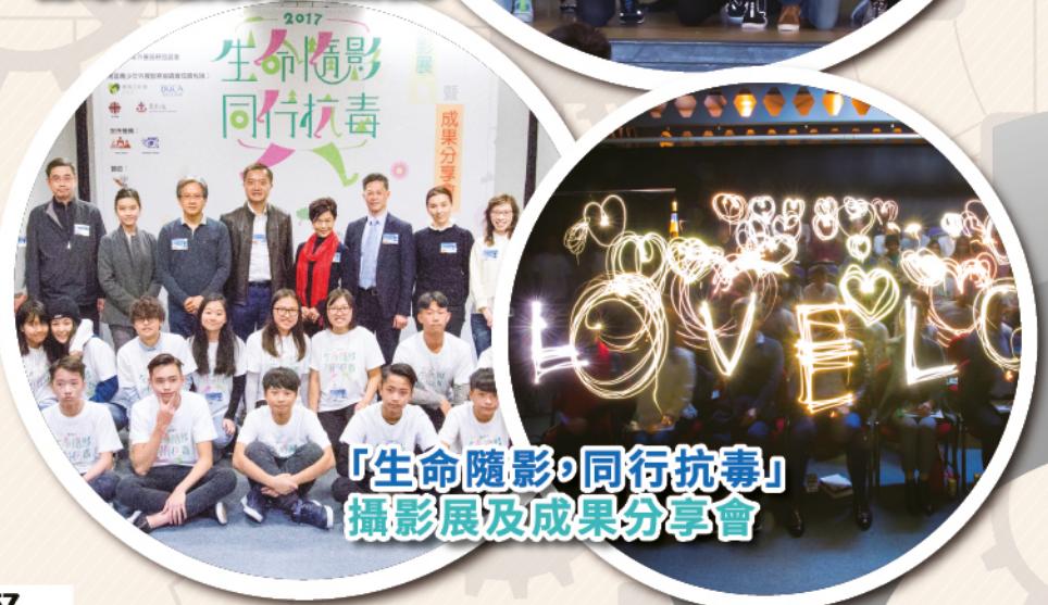
「生命隨影·同行抗毒」 攝影展及成果分享會