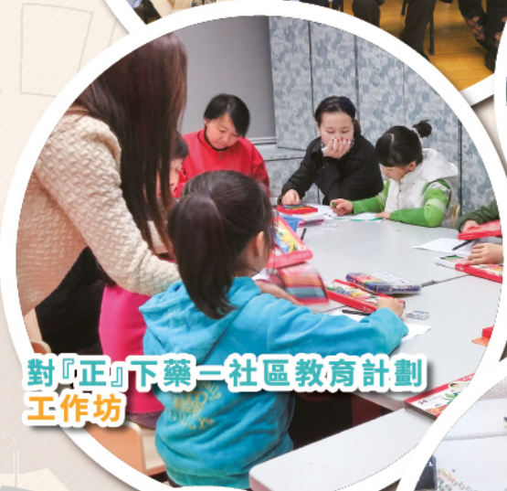
對「正」下藥—社區教育計劃 工作坊