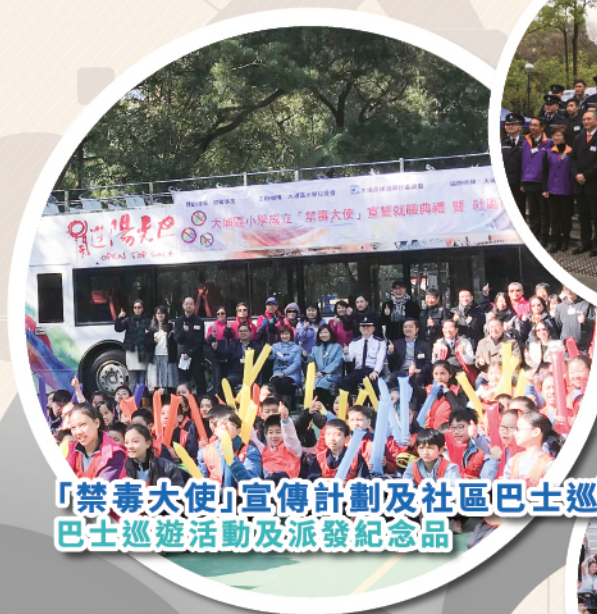
「禁毒大使」宣傳計劃及社區巴士巡遊活動 巴士巡遊活動及派發紀念品