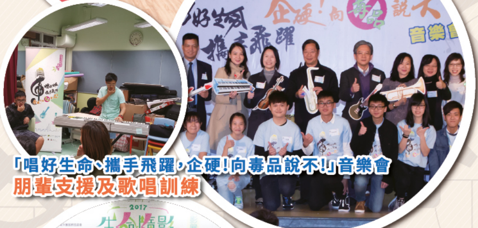
「唱好生命·攜手飛躍·企硬!向毒品說不!」音樂會 朋輩支援及歌唱訓練