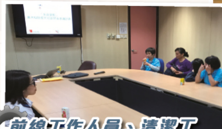
前線工作人員、清潔工