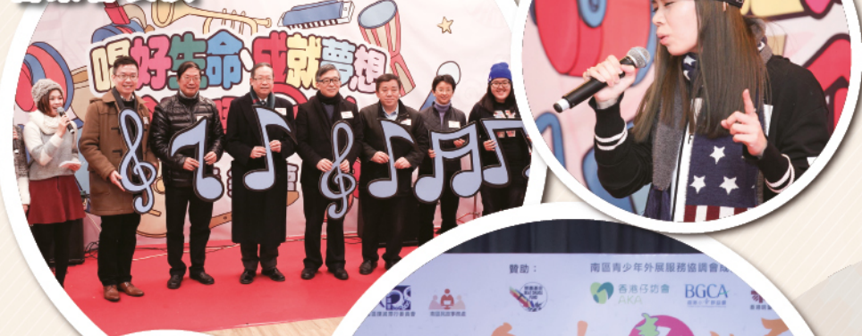
「唱好生命·成就夢想·企硬!唔Take嘢!」音樂會 音樂會表演

「有原則·唔TakeDrugs」計劃 抗毒桌遊設計訓練小組活動、歷奇訓練營、 家庭遊、親子活動