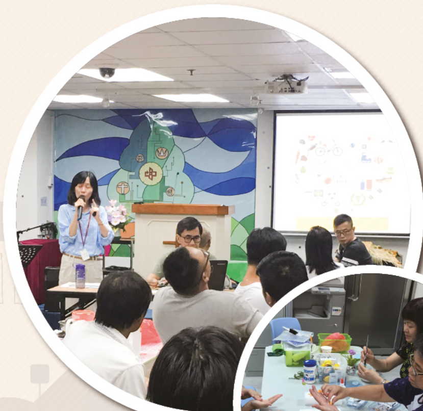
「阡陌同行II」計劃 家人小組

有關「阡陌同行II」計劃內容，詳情可瀏覽FACEBOOK( https://www.facebook.com/sanecentre )