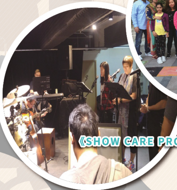
《SHOW CARE PROJECT·在乎你》 音樂分享會