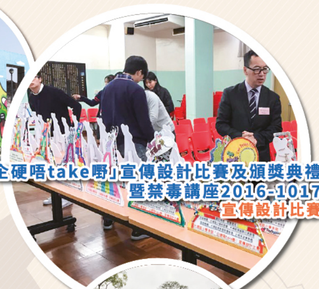
「企硬唔take嘢」宣傳設計比賽及頒獎典禮 暨禁毒講座2016-1017 宣傳設計比賽