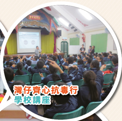
灣仔齊心抗毒行 學校講座