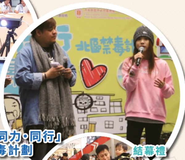
「同心·同力·同行」 社區禁毒計劃