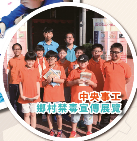
中央事工 鄉村禁毒宣傳展覽