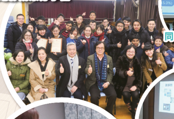
「BEAT DRUGS 你有 SAY我有SAY」 微電影成果分享禮