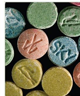
亞甲二氧基甲基安非他明興奮劑