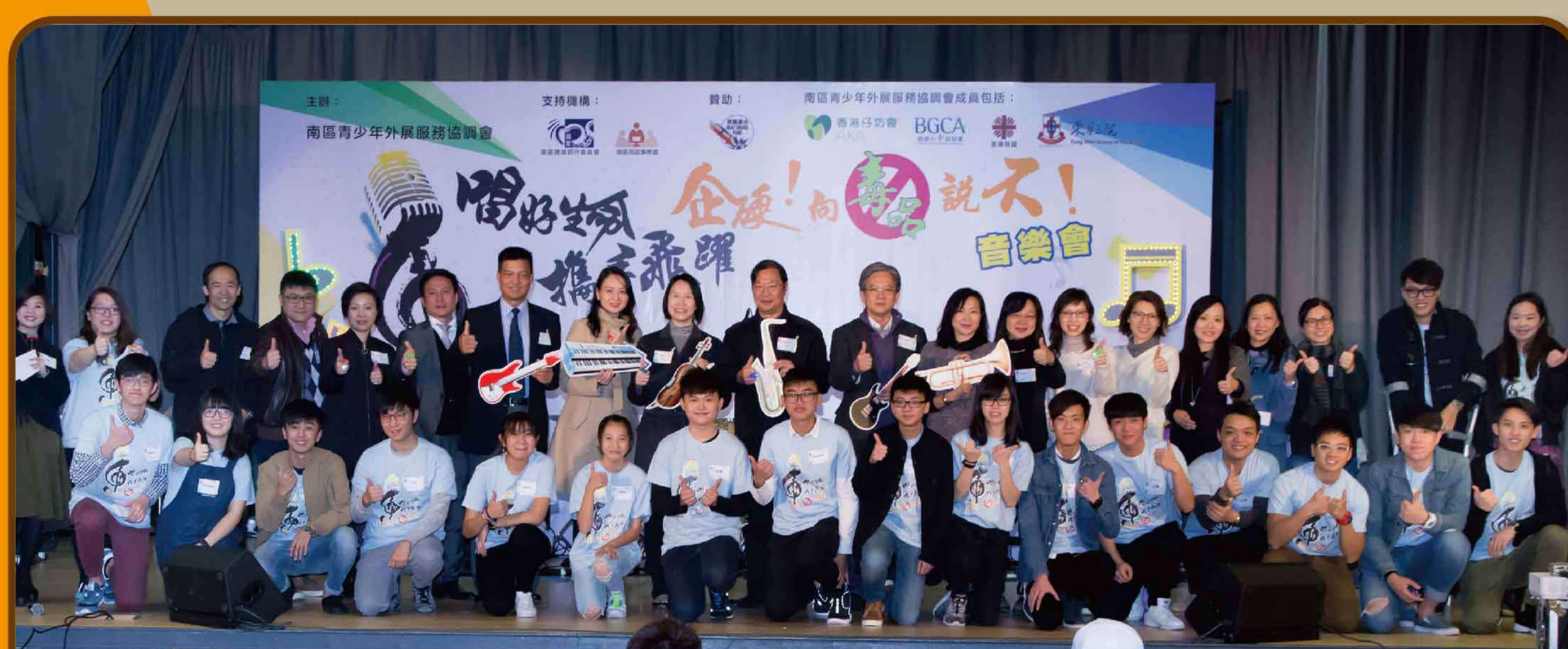
南區 - 唱好生命、攜手飛躍，企硬！ 向毒品說不！音樂會