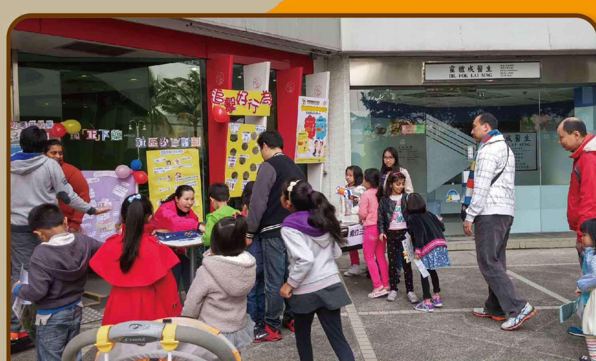
九龍城區 - 社區抗毒推廣活動

探訪戒毒院舍、進行禁毒話劇、義工培訓、興趣小組、同樂日、社區抗毒推廣活動等，提升社區的整體禁毒意識。