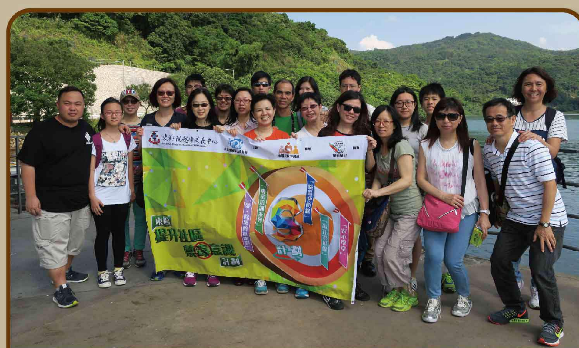
東區 - 探訪戒毒院舍