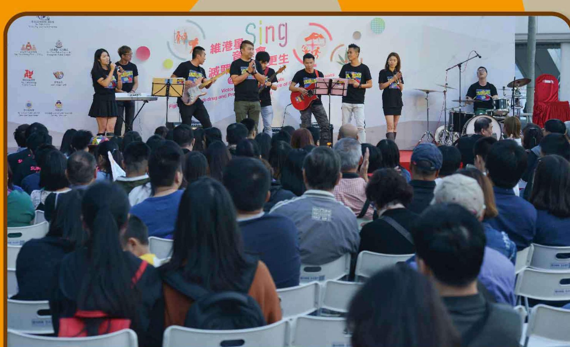
油尖旺區 - 禁毒同樂日