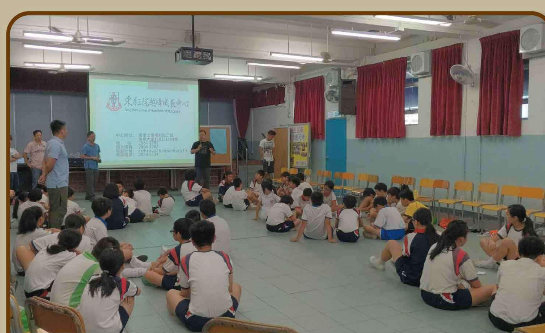
離島區 - 社區禁毒教育活動