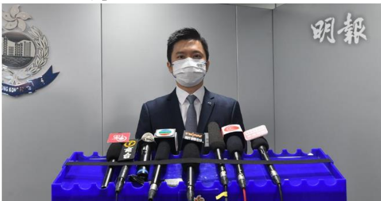
圖1-1-警方毒品調查科署理總督察陳熾輝交代反毒品行動情況。

毒品調查科聯同各大總區在8月15日至31日，進行一個代號為「捍衛者」的行動，共拘捕212男38女，年齡介乎14歲至80歲，被捕罪名包括 製毒、藏毒、販毒、經營毒窟、管有第一部毒藥、藏有吸食毒品工具，以及吸食或注射毒品 等，20名未成年被捕人士中，10人是學生。