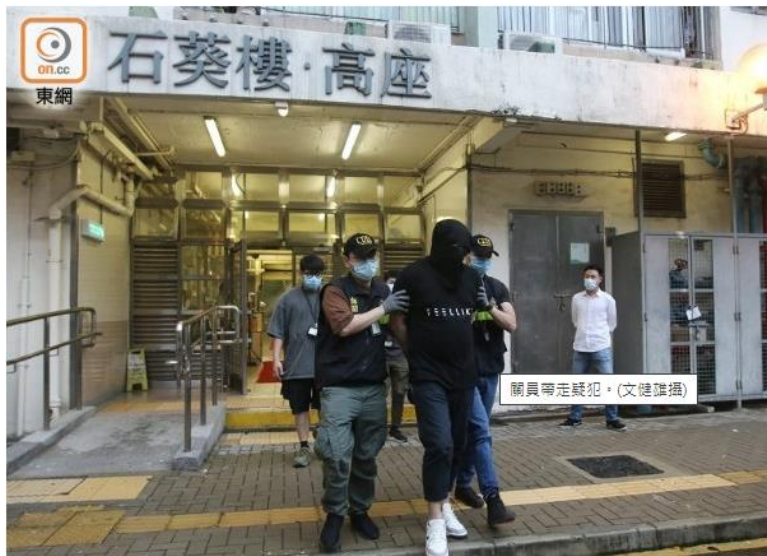
關員帶走疑犯。