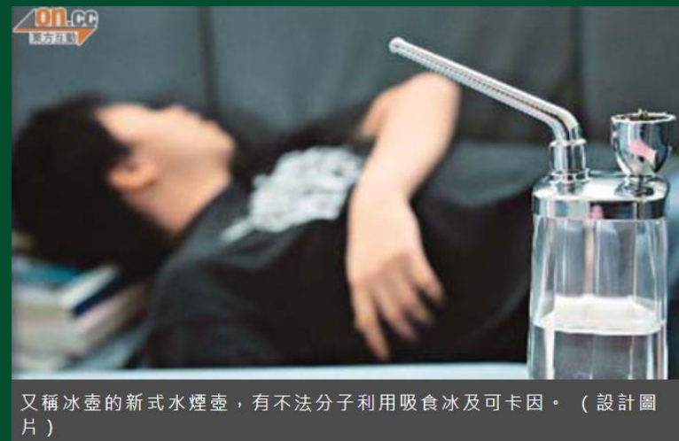
又稱冰壺的新式水煙壺，有不法分子利用吸食冰及可卡因。（設計圖片）