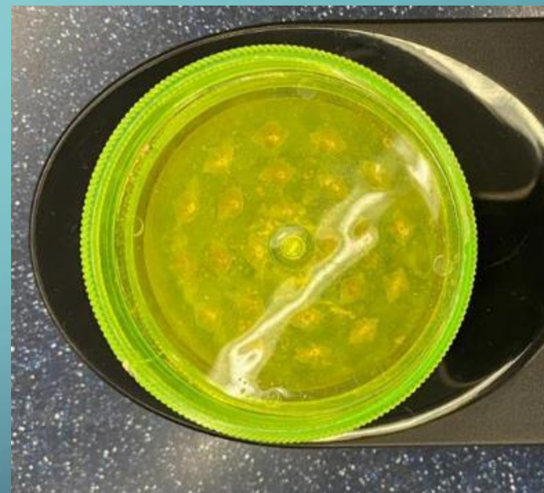
大麻研磨器 / 「草磨」